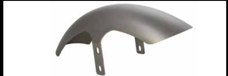
Frontfender, Stahl, Breakout 21" Front fender, steel Breakout 21"