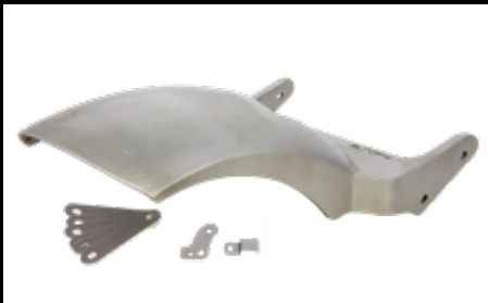
Heckfender 943,- € Stahl, für 180er oder 200er Bereifung Rear fender, steel, for 180 or 200 tyre