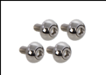
Befestigungskit Edelstahl, poliert

Mounting screws stainless steel, polished