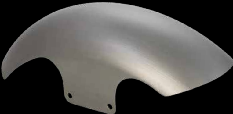
Frontfender, Stahl Front fender, steel