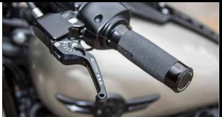
Rick's verstellbare Brems- & Kupplungshebel „Good Guys“ silber / schwarz oder schwarz / schwarz, inklusive ABE Rick's adjustable brake- and clutchlever „Good Guys“ silver / black or black / black, including homologation