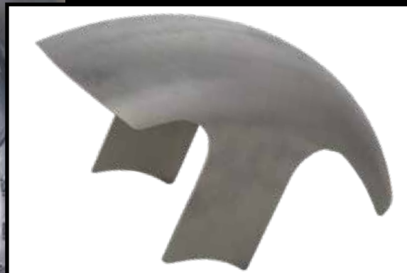
Frontfender Stahl, 16" Slim, Heritage, Deluxe Front steel fender, 16" Slim, Heritage, Deluxe