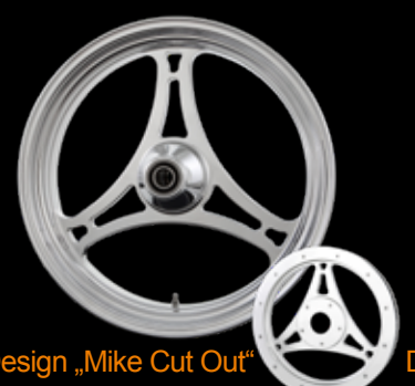
Design „Mike Cut Out“