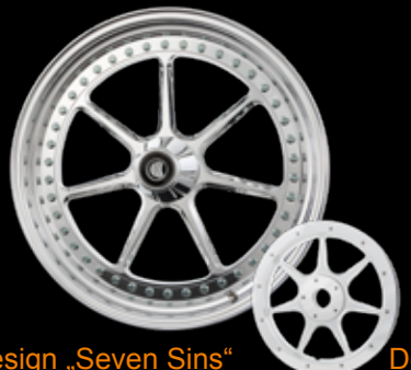
Design „Seven Sins“