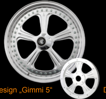
Design „Gimmi 5“