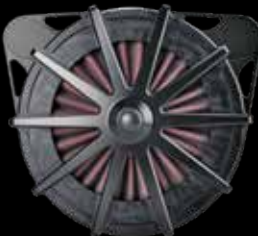
Design „Spoke black“