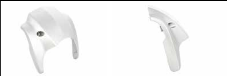
Rick's Lampenmaske Breakout Rick's headlamp cover Breakout