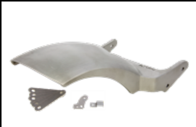
Heckfender 943,- € Stahl, für 240er oder 260er Bereifung Rear fender steel, for 240 or 260 tyre