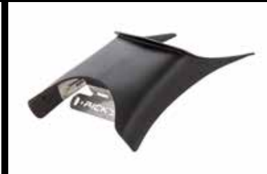
Tank- Rahmenblende 189,- € Tank- / framecover