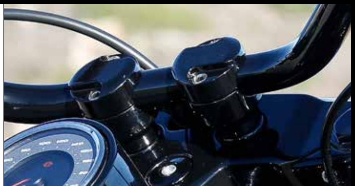
Rick's Riser „Classic“ für 30mm und 1“ Lenker, Höhe 40mm, schwarz oder poliert Rick's riser „Classic“ for 30mm and 1“ handlebars, height 40mm, black or polished