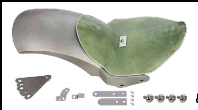
Heckfender Kit, inkl. Fender, Heckteilbefestigungskit und Sitzbankgrundplatte Rear fender Kit, incl. fender, mounting screws and seat base plate