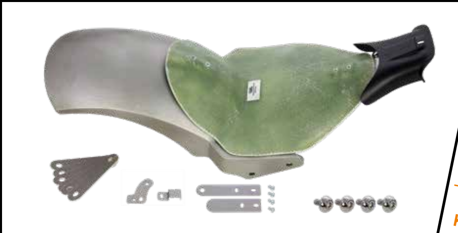
Heckfender Kit, inkl. Fender, Heckteilbefestigungskit, Sitzbank- grundplatte und Tank-/Rahmenblende

Rear fender Kit, incl. fender, mounting screws, seat base plate, tank- / framecover