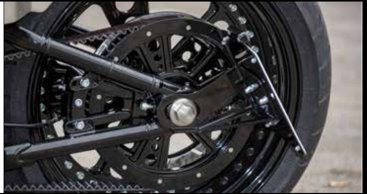
Rick's Kennzeichenhalter seitlich Kit bestehend aus Halter, Grundplatte und Kennzeichenbeleuchtung Rick's side mount license plate kit Kit including bracket, plate and license plate light