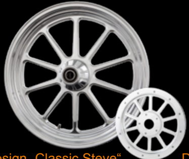
Design „Classic Steve“