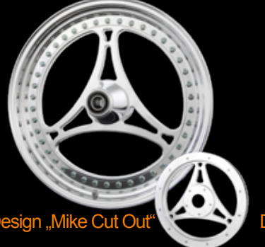
Design „Mike Cut Out“