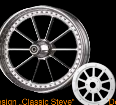
Design „Classic Steve“