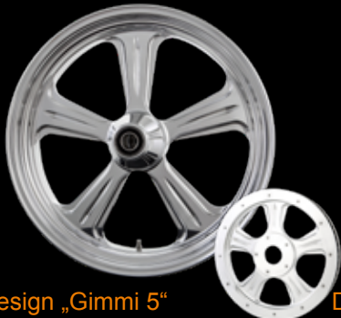
Design „Gimmi 5“