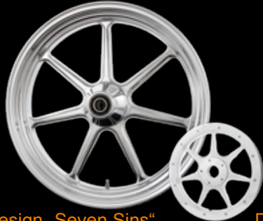
Design „Seven Sins“