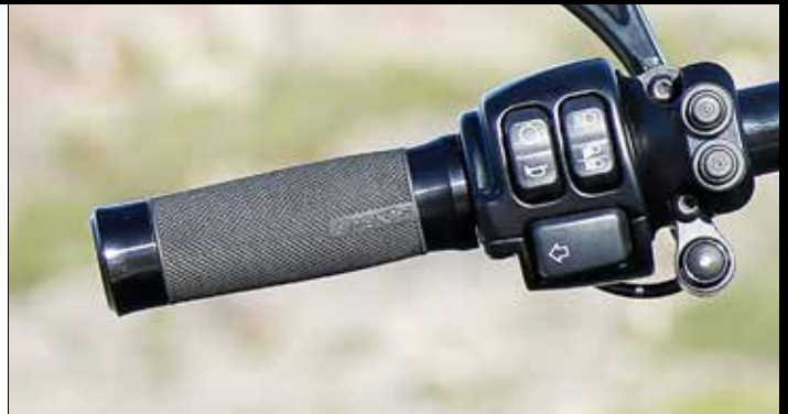
Rick's Griffset, Aluminium schwarz eloxiert oder verchromt Rick's grips, aluminium black anodized or chromed