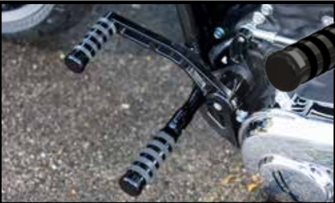
Rick's Design Fußrastenanlage, schwarz eloxiert oder poliert. OEM, +2" oder +4" Vorverlegung ab 945,- € and up Rick's design forward controls, black anodized or polished. OEM, +2" or +4" extension