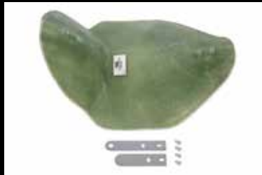
Sitzbank- grundplatte GFK