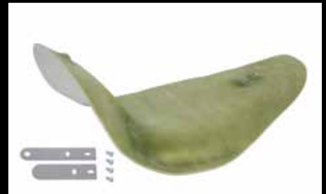
Sitzbank- grundplatte GFK 189,- € Seatbaseplate, GFK