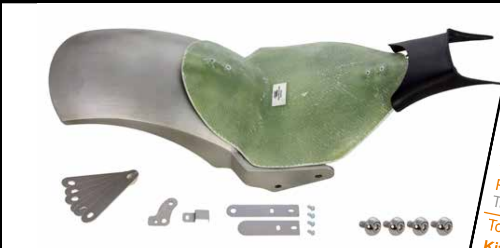
Heckfender Kit, inkl. Fender, Heckteilbefestigungskit, Sitzbankgrundplatte und Tank-/Rahmenblende