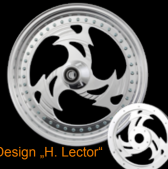
Design „H. Lector“