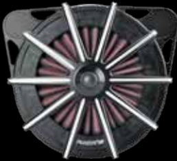
Design „Spoke bicolor“