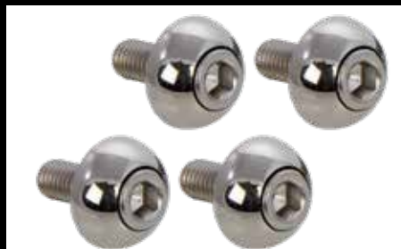
Befestigungskit 59,- € Edelstahl, poliert Mounting screws stainless steel, polished