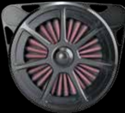
Design „Seven Sins“